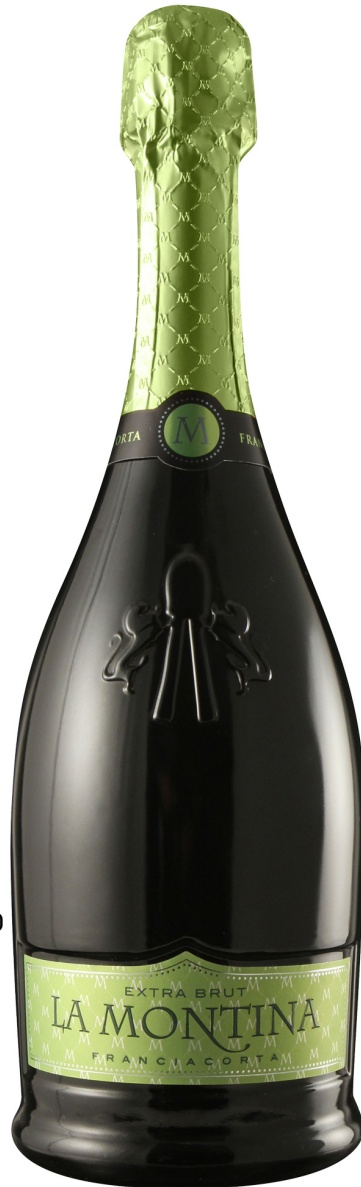
25% Pinot Nero